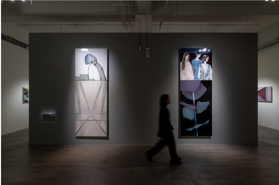
Image: “Chen Yun : Entering the Dissipating Fog of Fragments Light” at YIRI ARTS © the artist.

如何將倏忽即逝的記憶片段留存下來？從文字、繪畫、雕塑到影像，這樣的問題始終縈繞著創作者。時間沒有休止的流逝，人的意識也瞬息萬變的流動，那麼，無論用什麼樣的手段，都像刻舟求劍一樣，在不可能銘記之中反反覆覆徒然地試著留下記憶。