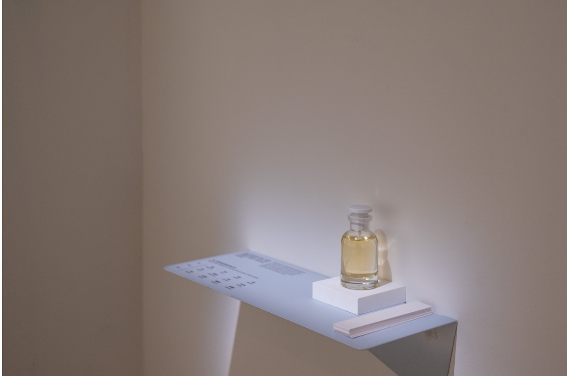
Image: “Chen Yun : Entering the Dissipating Fog of Fragments Light ” at YIRI ARTS © the artist.

重新疊加、融合而成新的記憶。她甚至使用了調香呼應畫作，來強化這樣的聯想，甚至以嗅覺來鉤釣出人們的深沉回憶。