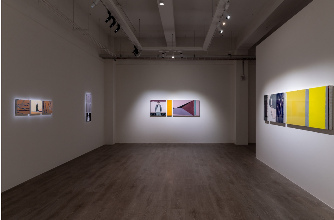
Image: “Chen Yun : Entering the Dissipating Fog of Fragments Light” at YIRI ARTS © the artist.

陳雲乍看如刻舟求劍的徒然嘗試，似乎是用盡各種方法，讓終將消逝的記憶得以透過視覺與嗅覺留存下來，實則更像是在表現記憶不斷變化、難以捕捉的本質。她的作品打開了記憶的潛質，讓它在觀者各自不同的想像之中，跳脫了藝術家原初的記憶，無盡地增生繁衍。這或許就是畫家對記憶最為真實的狀摹。