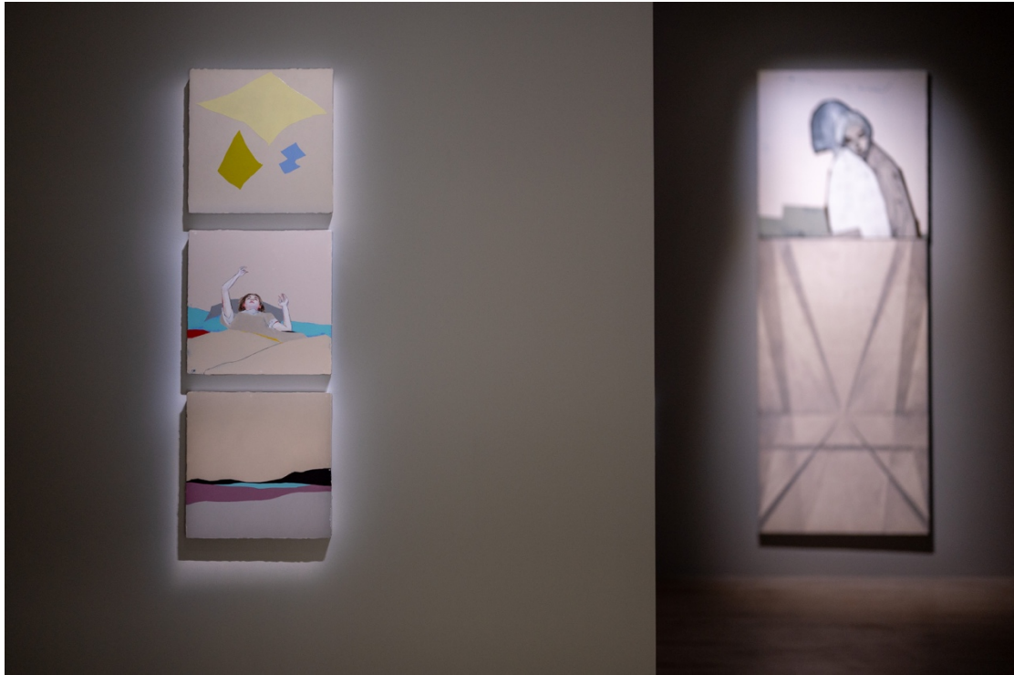
Image: “Chen Yun : Entering the Dissipating Fog of Fragments Light ” at YIRI ARTS © the artist.

在〈嚙。觸及若夢似真片片斑斕〉，陳雲則透過空間的遊戲，由躺臥著的人影將觀者引入似夢非夢的情境裡。畫面中間不知是睡是醒的人，伸手彷彿就能觸碰到漂浮在半空中的斑斕光影，讓觀者幾乎以為她仍未進入夢中，但下方空幻的場景卻又在告訴我們這一切並不真實。